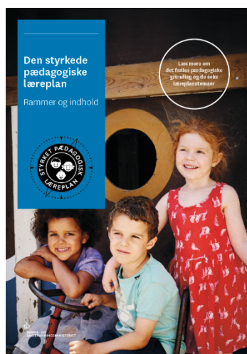
Den styrkede pædagogiske læreplan. Rammer og indhold

Denne skabelon indeholder alle de lovmæssige krav til evalueringen. Lovkravene finder I i de to midterste afsnit "Evaluering og dokumentation" og "Inddragelse af forældrebestyrelsen". Skabelonen indeholder desuden spørgsmål, som kan støtte jeres evalueringsproces samt jeres fremadrettede arbejde med løbende at revidere den skriftlige læreplan.